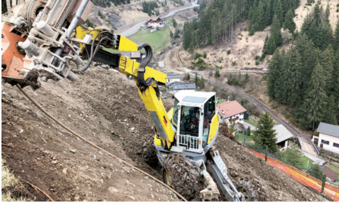
Pra l troi dla ferata iel uni laurà cun de gran mascins

Mo dan Pasca àn scumencià cun l mèter apost l troi dla ferata, taian lëns, seguran chi ronesc ulache l fova pricul de tumeda de sasc. Cun de gran mascins iel uni laurà drèt apuntin su per chi ertons. L crëp sotite ie uni metù n segurèza y l ie uni trat na gran rë de fier sèuravia. Ch'l gran toch de peton che fova dessot ie uni desfat; te chëla luegia iel uni fat su n mur a sèch. L ie stat do la rata n gran lëur, plu de chël che n se ova pensà, nsci che la durerà pa bën mo n pez nchin che n puderà se nuzé dl troi.