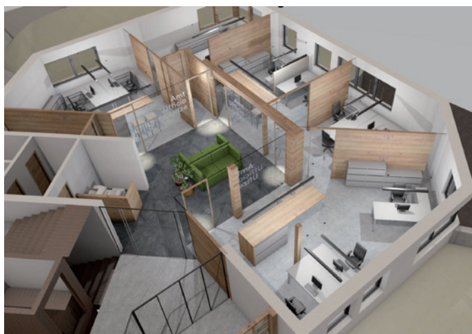
N "rendering" di ufizies jubas