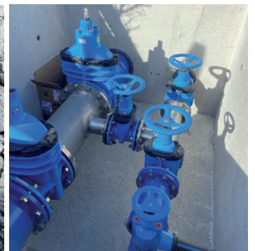
A man ciancia vèijen coche cialova ora l vedl sistem per zirculazion dl'ega y a man drèta l'implant nuef de aciel inox.