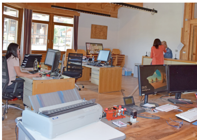
I zitadins muessa ji te sala dl cunsèi per cuestions anagrafiches.