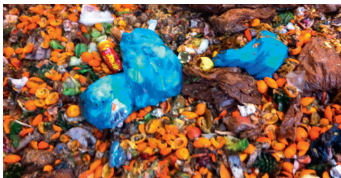
Sollte nicht sein, muss nicht sein. Plastiksäcke haben in der Biomülltonne nichts zu suchen!

Das Material "Bioplastik" ( handelsüblicher Name: Mater-Bi ) ist nur bei Vorhandensein von Sauerstoff und in langen Zeiträumen, in mehr als 6 Monaten, abbaubar. In der Vergärungsanlage Lana erfolgt der Prozess der Zersetzung des organischen Abfallanteils ohne Sauerstoff und dauert nur 25 Tage. Somit wird der Werkstoff "Bioplastik" in dieser Anlage nicht zusammen mit dem organischen Abfallanteil abgebaut und wirkt daher – wie