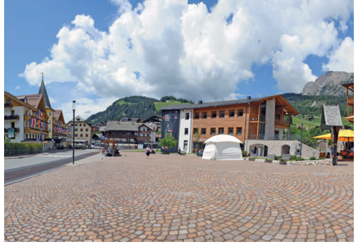
I "cubetti" de porfir fova sën melciafeï y gran èura de i baraté ora.