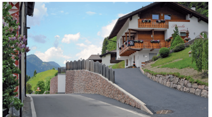
La raida de Pigon ie sën plu lergia.

For inò univel a s'l dé tl passà situazions de viabltà mpue ncompres tla raida da Pigon , davia che iló stēnta doi auti a se passé via. Nscila an zarà ju l mur (che fova nce melciafià) y spustà de n 40 zm a na maniera che l ne sibe nia plu tan na stentura te chël post. Chësc lëur ie uni a custé ntèur a € 28.000,00.