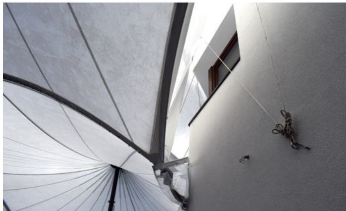
Sono stati modificati gli ancoraggi della tensostruttura.

È approvato il contratto di affidamento dei lavori di modifica degli ancoraggi alla facciata del municipio , montaggio, smontaggio e lavaggio della tensostruttura della piazza comunale alla ditta Paller s.r.l. per una somma di € 46.700,00 oltre all'IVA;