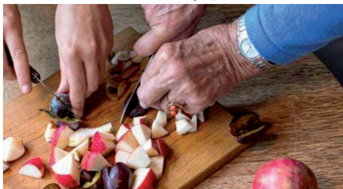
La grupa "É dlaurela" se tol propi dlaurela per vel'pittl stroz.