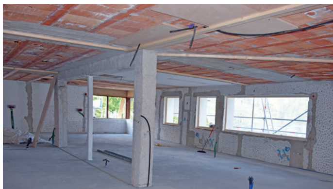
Local ulache l ruva ite l ufize anagrafich y l ufize dla chëutes.