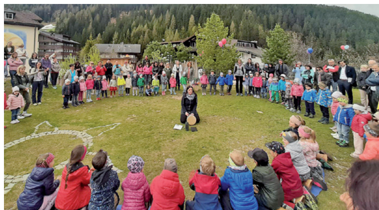
Deplù juesc à i mutons y la mutans fat deberieda cun si genitores.

Ntan la sèira iel nce uni fat vel' dumanda n cont dl transport dla rodes cun la curiera, nce chèsta na problema-tiga che n messerà cialé de resolver tl dauni, sce la jènt uel per ejèmpl furné da Sëlva nchin a Urtijèi cun la roda y pona de reviers cun la curiera.