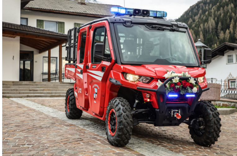
L veicul nuef ie uni benedi da Sn. Ivo y sarà de utl per mené massaria y nce i destudafuech te raions ulache n stënta a ruvé permez.

Unèur se à Florian inò fat pra i campjunac talians de sledgehockey che ie stac de auril a Neumarkt. Deberieda cun la squadra South-Tyrol Eagles àl batù la furmazion dl'Armata Brancalone se seguran nsci l titol naziunel, l 15ejim tla storia. Florian à danterauter fat pea sies iedesc pra i juesc paralimpics; dl 2018 a Pyeongchang àl purtà la bandiera taliana pra la zerimonies.