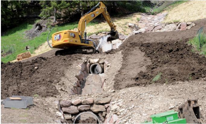
Lèures tl raion de Spinaces y Schlosser