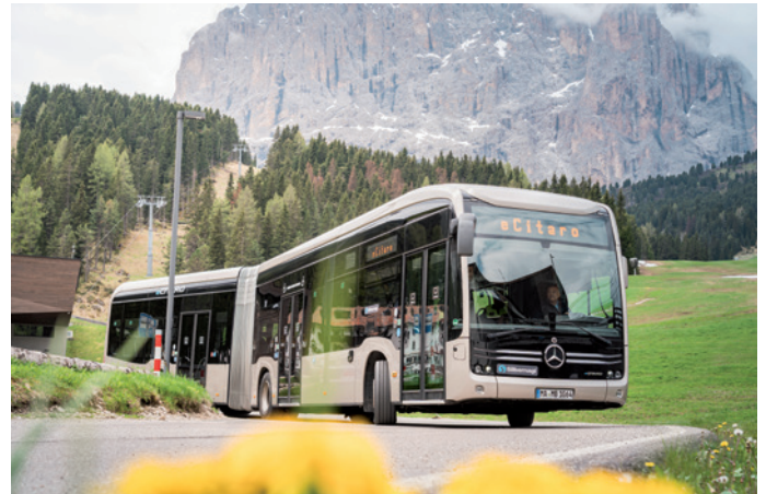
Bereits ab diesem Sommer auf den Straßen Grödens zu sehen: ein Elektrobus

Ende Mai fand gemeinsam mit dem Land eine technische Abnahme der Haltestellen für den 18-Meter-Elektrobus statt. Der Bus fuhr dabei von Pontives bis zum Sellajoch. Es wurden dabei die Haltestellen und Wendemöglichkeiten begutachtet. Das Gutachten konnte als positiv bewertet werden, so dass in diesem Sommer der erste Elektrobus in Gröden eingesetzt wird. Weitere Busse sollen dann folgen. Dies ist Teil des Masterplans für das Verkehrskonzept Gröden, an dem nun verschärft gearbeitet wird.