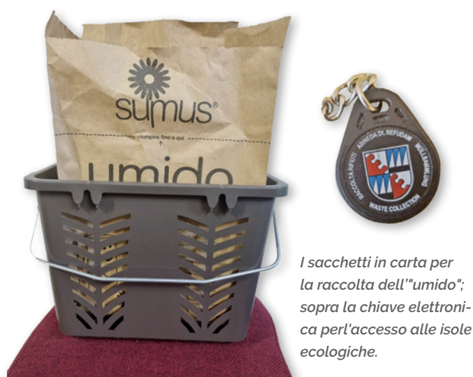
I sacchetti in carta per la raccolta dell'"umido"; sopra la chiave elettronica per l'accesso alle isole ecologiche.

Ad ogni seconda segnalazione di svuotamento strapieno sarà addebitato uno svuotamento aggiuntivo