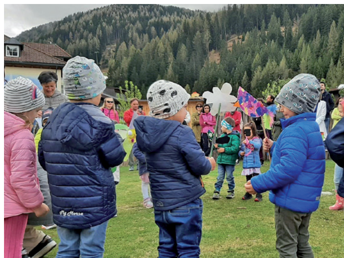
I mutons y la mutans à saludà duc i presènc cun cianties y bai.

La maestres, la culaburadèures pedagogiches y dantaldut i mèndri dla scolina "L surèdl" sènt gra a duc chèi che à judà a realisé chèsc bel verzon y a duc chèi che ie unic a festejé.