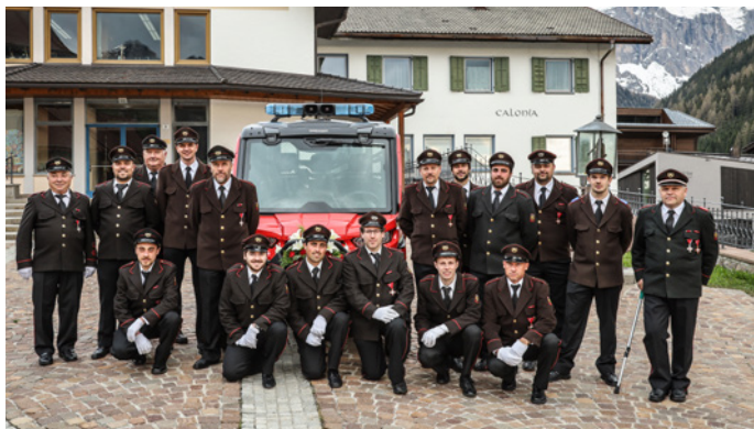
Uemes di destudafuech n San Flurian dan l veicul nuef