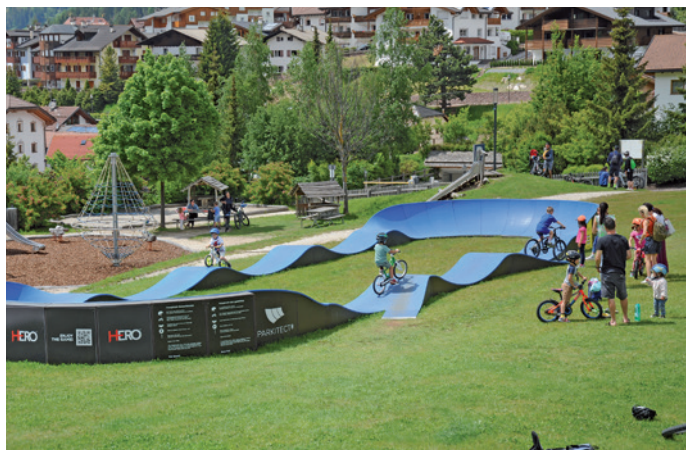
L Pump Trail sun pra da Nives, na atrazion dantaldut per i mèndri

L ambolt de Sëlva Roland Demetz à cuntà de tan inant che n ie perdrèt cun i lèures dla Rodaval , n proiet che n ova nvià via bele dan urmei plu de 20 ani y che se à trat scialdi n lonch. Metù man cun chèsc proiet ova n iede i chemuns dla valeda y pona ie dut uni dat inant ala Cumenanza raiunela Salten-Scilier, che se cruzia dla realizazion di toc. La idea ie chèla de cunliè Sëlva cun Urtijèi, ntant nchin ora Puntives y pona nchin San Piere y Tluses. Ma ti ani iel for inò stat vel problematica nueva che à fat a na maniera che dut se ntardivova: l mancio- va i scioldi, l mudova aministrazions de chemun, pona