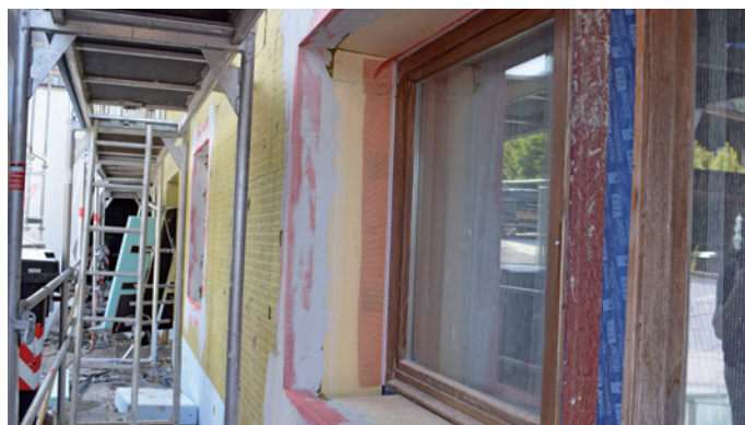
Tlo vëijen la grussèza dl iulamënt termich pra n viere.