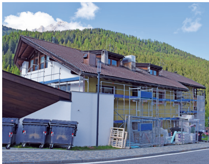
Cun l ressanamënt energetic arà la cèsa de chemun l standart "B".

L local basite ulache l ie l ufize anagrafich y dla chëutes iel unì trat ju duta la strameses y l fajerà ite na spartizion nueva coche n possa nce udèi sun l "rendering" tlo dessot. Al mumënt ie chisc ufizies metui ju te sala de chemun ma n spera che bele per la fin de lugio, scu-menciamënt de agost puderan trapiné jubás. La nozes n zevil ie unides fates te "Tublà da Nives".