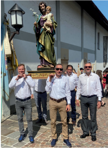
Artejans cun la ciamëjja blancia che porta si patron, S. Ujep.