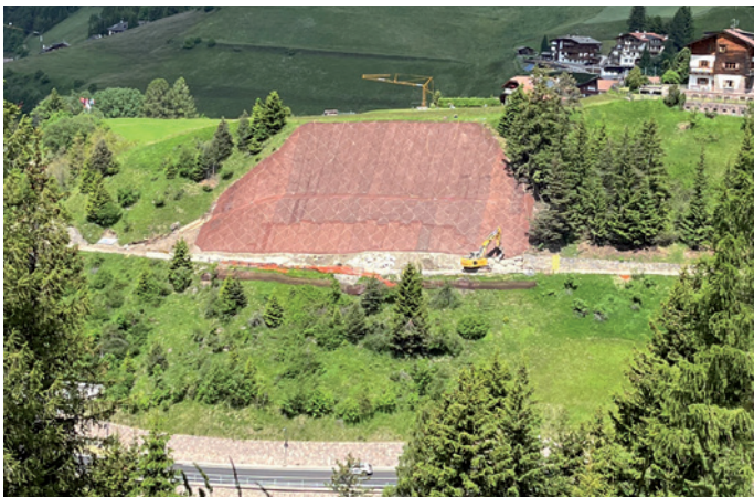
Cun na gran rë iel uni metù al segur l rone sèura troi