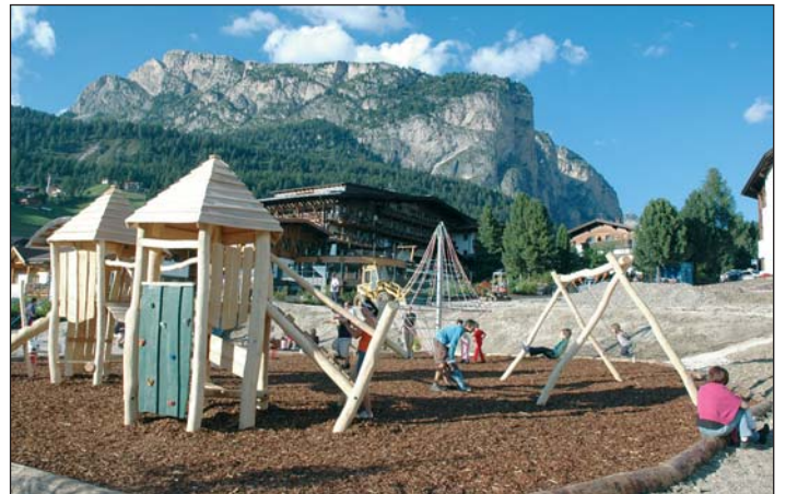
La plaza nueva dai jueusc tl raion Nives.

La streda sèura la cèsa de chemun via nchin pra la biblioteca ie unida asfaltada