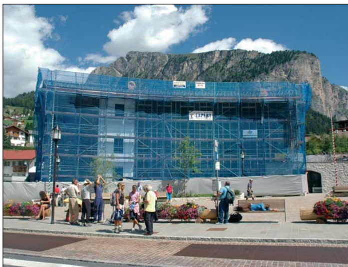
Per l'edificio polifunzionale in piazza Nives sono stati approvati alcuni progetti esecutivi

Riguardo alle vertenze giudiziarie con la Società S.I.F. Selva S.p.A. in merito alla procedura di imposizione della servitù per pista da sci, aerea e di elettrodotto è stato approvato l'onorario conclusivo all'avvocato difensore del Comune.