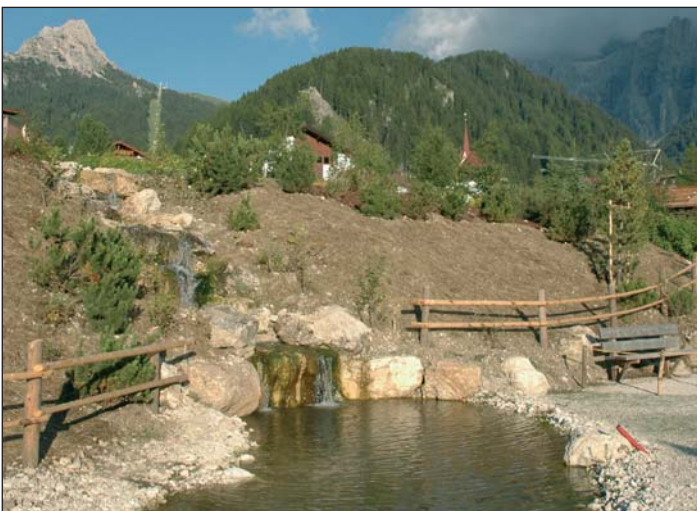
L biotop sota l' hotel Gran Baita, ulache l' ie nce doi pitli lec.

L'ie stat n gran lèur per l'aministrazion de chemun che ova nvià via duc i lèures y che messova sën unic finei vai. L'ie stat deplu problems che à da una na pert ntardivà vel lèures nsci che autri ne pudova nia plu jì inant o uni completei. Nce sce da pert de zitadins iel stat - povester nce cun rejon - deplu critighes per via dla fuera y dl stuep, iesen te chemun mpo dla minonga de avèi fat n bon lèur y che l' utl uderàn permò ti ani che vën. Sciche aministrazion de chemun iesen tachei a truep regulamènc y nscila ne possa mefun n valgun lèures nia unic purtei inant sciche canche n privat fabrica.