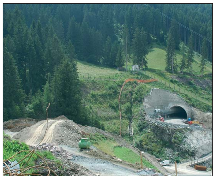
Pra l tunel "Saslonch" iesen sën ruvei a plu dl mez.

fova udui danora per la fin dl'ann. La realizazion dl tunel Saslonch ie un di doi tuniei che fej pert dl cunzet dla streda de zircunvalazion dla Chemun de S. Cristina, l mesura 375 m y cun na pendènza media de 6,5 % y na larghèza media de 8 m cunsëntel de viagè a 60 km/h. L cunliamënt danter l tunel y la streda tla raida da Dorives unirà a sl'dé tres n puent de 47 m. I lëures de duta la streda de zircunvalazion dëssa vester finei per fauré dl 2009.