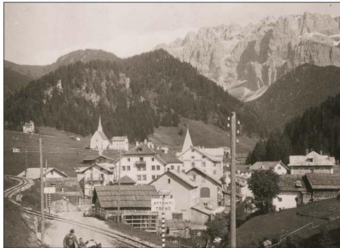
Na bela y vedla documentazion storica dl luech de Sëlva

La grupa de lëur ie dassënn cuntënta che la jënt de nosc luech à tan judà pea per pudèi abiné ca na tel bela cumpèida y reingrazia mo n iede duc canc. La fotografies ne n'ie mo nia unides retudes, davia che n à propi sën l gran lëur de scrì su inuemes dla persones che ie sun la fotos; plu dessegur saral l cajo de messèi mo n iede damandé do vel' un plu avisa. Speron che duc ebe mo mpue de paziënza!