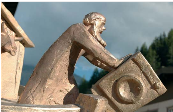
Noah wirft eine Waschmaschine über Bord und schafft Platz für Lebewesen

Es ist eine ironische Interpretation einer biblischen Überlieferung. Die Arche, auf Felsen liegend und durch Stützen gesichert, erhebt sich über dem Wasserspiegel / Sintflut- unter dem Wasser sieht man materielle Gegenstände, denen man heutzutage so viel Bedeutung zumisst.