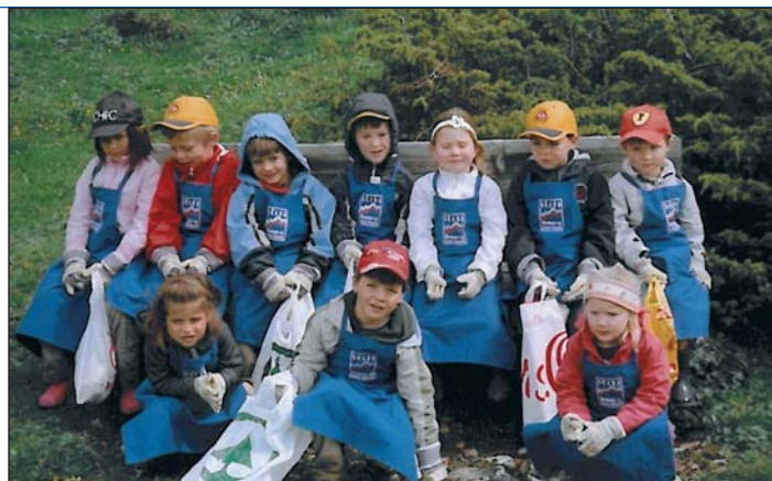
Mutons y mutans dla scolina de Sëlva ntan la scumenciadiva "Rumon su nosc luech".

I pitli mutons y la pitla mutans ie l daunì de nosta so-zietà y perchël sperons che ëi sibe de ejëmpl per n luech che viv y respetea la natura cun si belèzes y marueies.