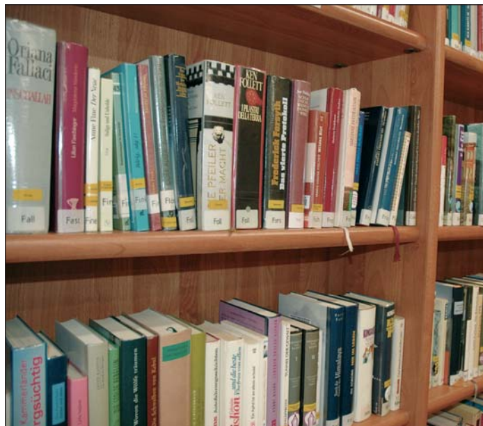
L'offerta formativa presso la biblioteca "Oswald von Wolkenstein" è assai ampia e variegata.

La biblioteca comunale Oswald von Wolkenstein di Selva Gardena ha sempre contribuito e contribuisce tuttora a costruire una certa