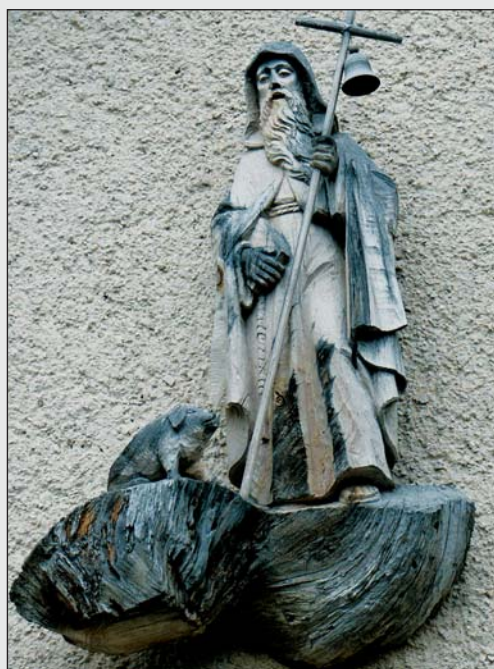
Sant Antone Abate, sant patron dl bestiam, da udēi sun mureda dl luech da paura Curzlon.

Nscila prioiven via per l'instà uni di mo altri sanc. Bele d'ansciuda jiven cun crēusc ora S. Crestina l di de San Merch per priē de na bona racolta y per n bon tēmp, propi per nterzescion de chēsc sant. Di per di se lecurdoven de priē San Flurian y San Bastian che i straverde cēsa y tublei da mel de fuech y dal tēune y i ciamps da sdramoc y tampestes. Nce San lacun suppli-coven n chēsc cont. S. Giuani Nepomucini nvucoven sēura l'eghes, che n ova gran tēma dala gran eghes y smueies y che gran ruves pudēssa zaré i mulins. Nia