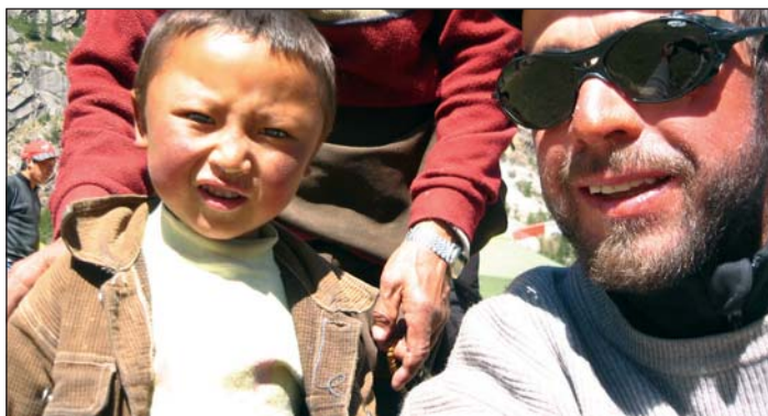
Fova tl lèur de nviè via n proiet uman de aiut per i pitli mutons dl Tibet.

nce cun comentares che n pudova se sparaniè, bele per respet dla familia tucheda da chèsc destin.