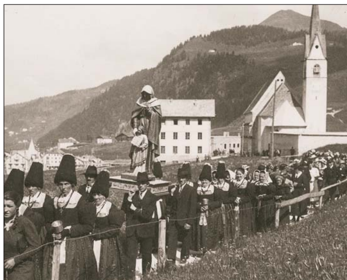
Tla mostra de fotografies sarà da udèi nce truepa fotografies che à da nfé cun la vita religëusa y festes de dlieja.