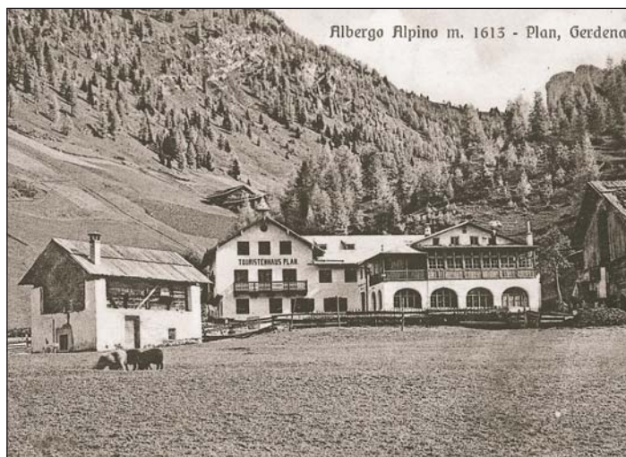
Nscila cialova ora l hotel Alpino te Plan zacan (ntëur l 1910)