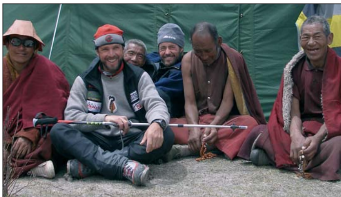
Karl se nteressova nce scialdi dla fede y spiritualità di populi ulache èl jiva a fé la spedizions; tlo l udons cun n valgun patri dl cunvënt de Nego Gompa

Nce a trueps de nëus ne lasciova chèsc pensier nia pesc, fan duc che tribulan speran de abiné o de audi nzaul vel nutizia che dajova cunfort. Ma plu che l passova l tēmp y plu che messan azeté la urità ncherscëula dla mort de nosc cumpani. Ma la storia ne finova nia tlo. Tla Talia oven riesc metù man de urganisé na azion de sucors (sceben che degun di alpinisè ne s'l ova damandà) y chësta scumenciadiva mpruviseda sun l ciaut ie deventeda per i mass-media n gran bucon. Di per di pudoven liejer dlonch ora uni pitl var dl sucors, sciche na tele-nuvela jiva la storia tres l internet y la zaites. Truepa redazions dla zaites dl Europa reperuova la nutizies suvènz