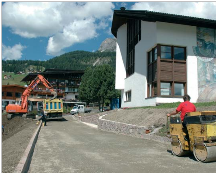
I lavori per la strada di collegamento municipio-biblioteca sono in fase di conclusione.

Sono stati approvati i rendiconti finali dei lavori di scavo e di demolizione per la