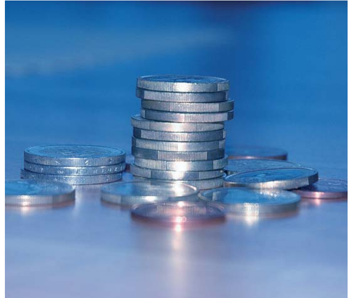
Il rendiconto del Comune si è chiuso con ca. 13,5 milioni di entrate e 13 milioni di uscite

Con diverse modifiche al piano urbanistico comunale è quindi stato modificato il tracciato della sciovia "Campo Freina", inserita una specificazione riguardo all'edificazione presso il centro sportivo dei Carabinieri in località Vallunga, inserita una strada comunale di tipo "E" in località Daunei e inserita una zona per infrastrutture negli ambiti sciistici presso la baita Vallonga.