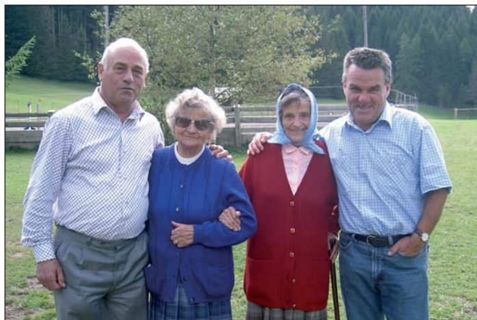
Zwei freiwillige Helfer und zwei Betreute beim Sommerfest der Hauspflege Gröden"

Die Auskunft erfolgt entweder telefonisch (0471 798015), per E-Mail (info.sprengelgroeden@bzg