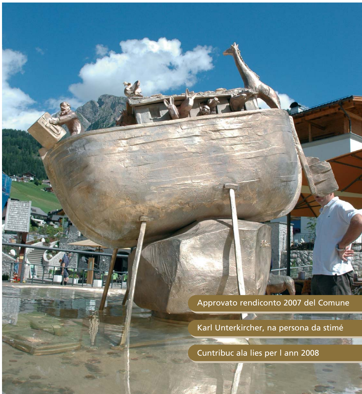
"L'Arca de Noé", scultura de Teo Mahlknecht pra l dròch sun Plaza Nives

PLATA DE NFURMAZION DL CHEMUN DE SĒLVA GHERDĒINA • MITTEILUNGSBLATT DER GEMEINDE WOLKENSTEIN FOGLIO INFORMATIVO DEL COMUNE DI SELVA DI VAL GARDENA - Nr. 04/2008 - 9 de agost 2008 www.selva.eu • www.wolkenstein.eu